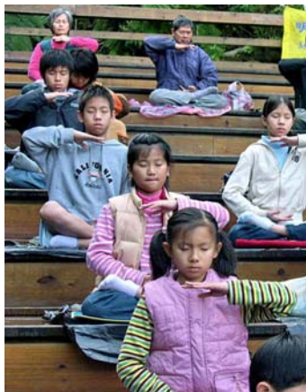
二零零九年台北明慧夏令营参与者午餐后炼法轮功第五套功法

两个月过去了，他身上的恶根似乎很难去除，很容易故态复萌，但变化还是在一点点发生着。除了请老师外，我时常睡前给他讲生活、讲历史故事，讲法轮大法的