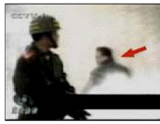
4、击打者仍保持用力姿势