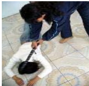
酷刑演示: 电棍电击